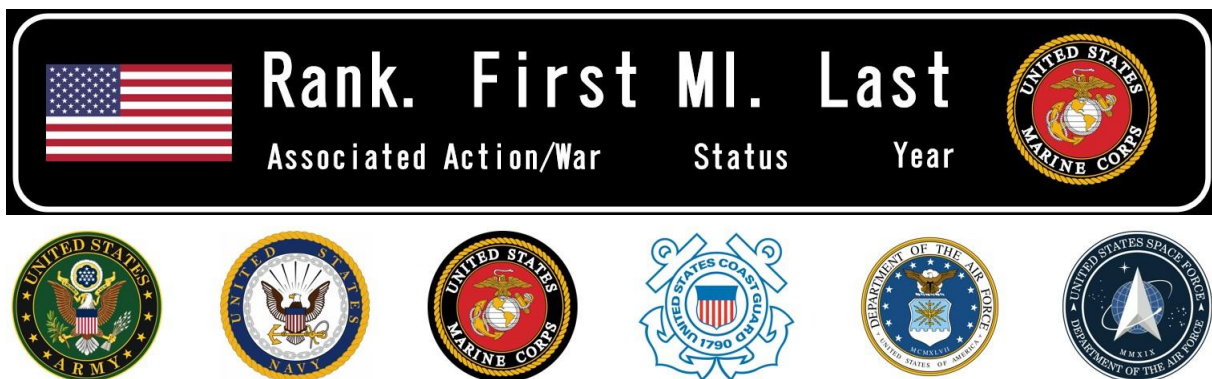
Figura 3 - Diseño de letreros y sellos de rama de las fuerzas armadas

Figura 3 muestra la ubicación de cada elemento y todos los elementos posibles con los respectivos sellos de ramas de las fuerzas armadas.