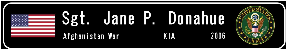
Figura 1 - Diseño de muestra del letrero con el nombre de la calle

Figura 1 muestra un ejemplo del diseño del letrero con el nombre de la calle.